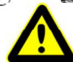
Physikalische Eigenschaften einiger tiefkalter Gase